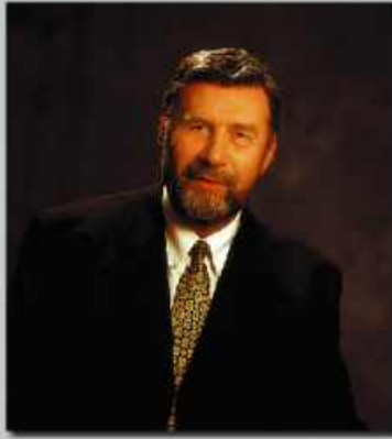
Eyðun Elttør landsstýrismaður í olju- og umhvørvismálum