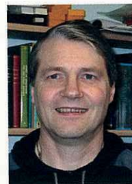
PALLI ASKHAM NÁTTÚRUGRIPASAVNIÐ

“Har vóru vit við børnunum síðsta ár, og tað var stuttligt!” hoyrdist frá fleiri fólki, tá ið ein lítill lýsing í bløðum og útvarpi vakti góð minni við at boða frá, at heystfagnaðurin á Náttúrugripasavninum fór at vera aftur í ár eins og síðsta ár.